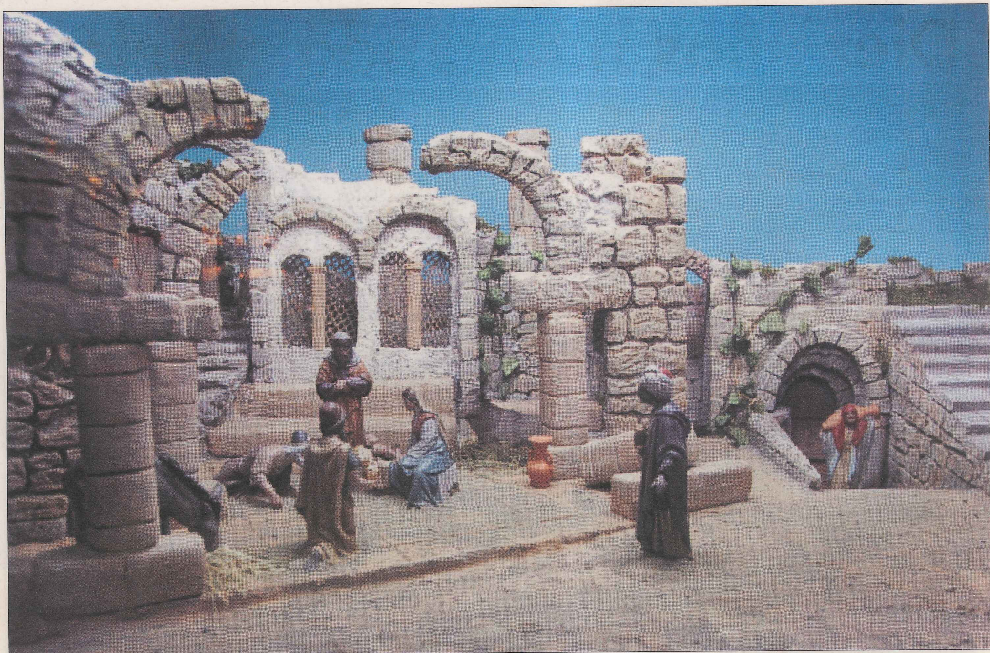
Las ruinas están perfectamente reflejadas. / PABLO REQUEJO