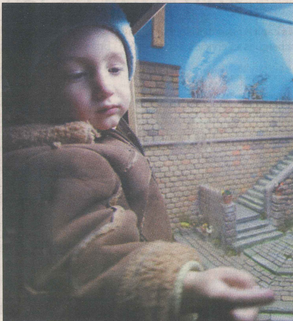
Los belenes despertaron la curiosidad de todos los visitantes. / PABLO REQUEJO