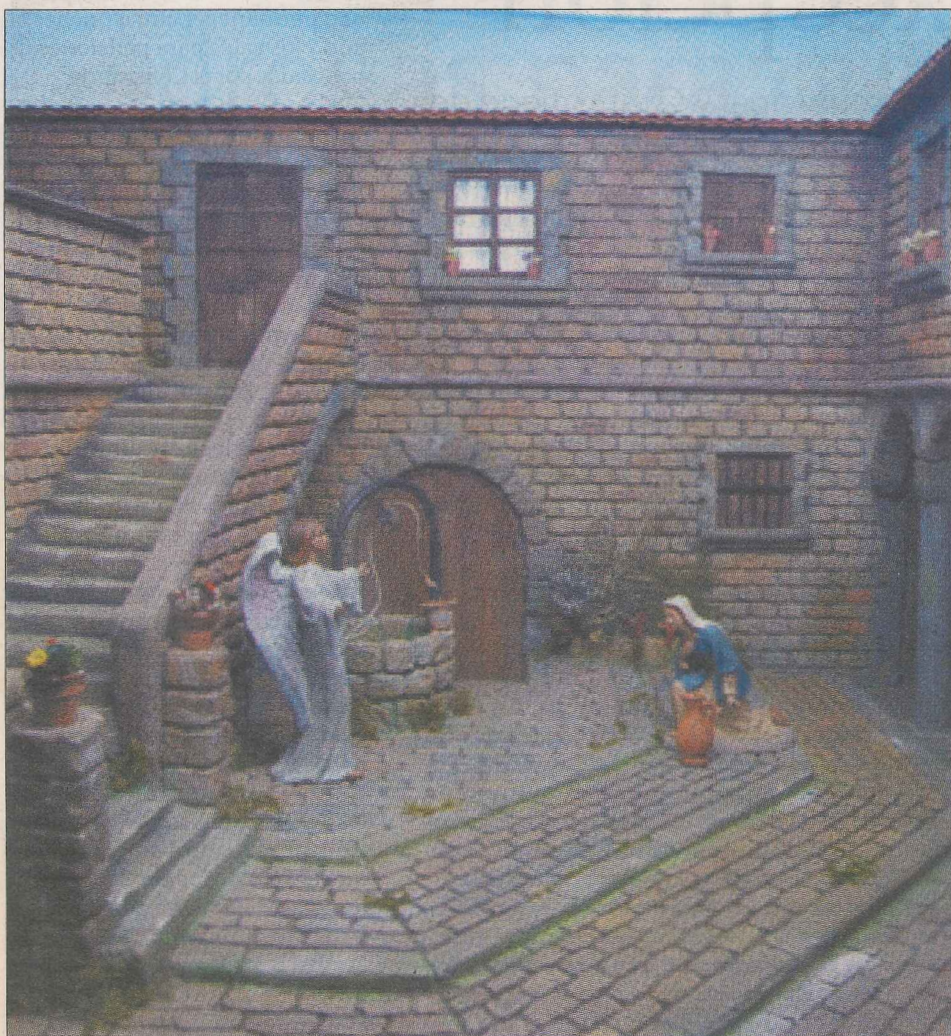
Los edificios marcan la diferencia entre unos belenes y otros.

Belenistas. La entrega de premios en los distintos concursos marcó el final de unas Navidades que significó un punto y seguido en la celebración del décimo aniversario de la asociación.