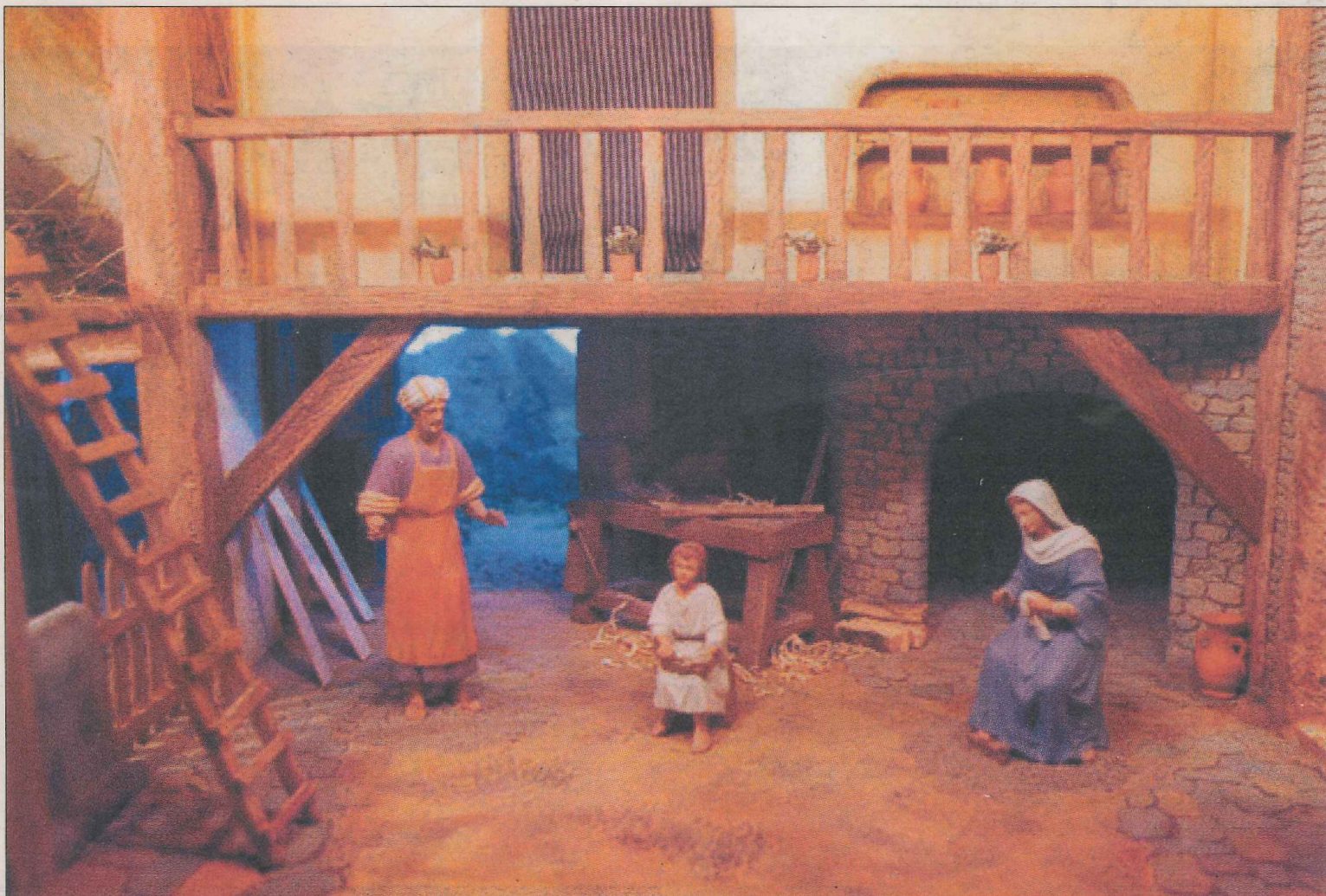
Los belenes están realizados con todos los detalles.

A esta celebración acudieron más de 150 personas procedentes de otras asociaciones de muy distintos lugares, tanto de la propia Comunidad Foral como de otras provincias. «Esta asistencia es reconocimiento a una labor que llevamos realizando durante diez años para fomentar esta bonita afición entre los villaveses». Pero también ha servido como motivación para continuar otros diez años más.